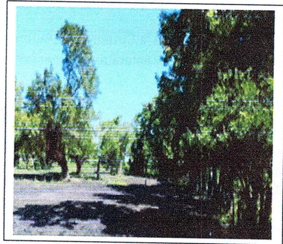
Imagen N° 1 Terrenos inadjudicables Pinillos Bolívar