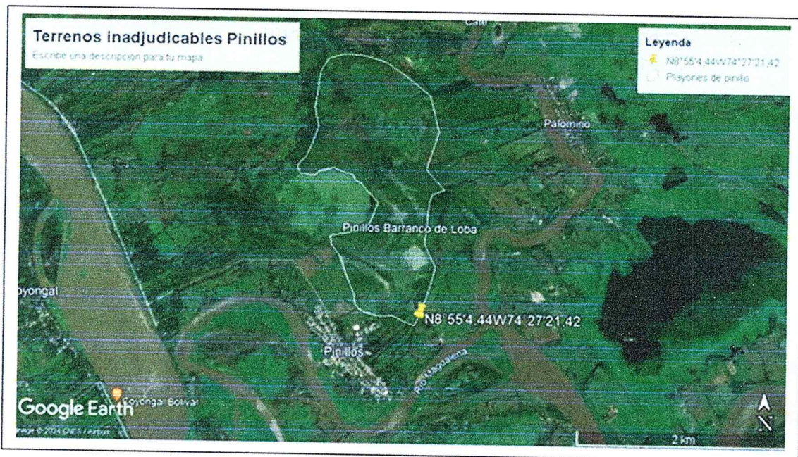
Imagen N° 2 Google Earth. Polígono en color blanco